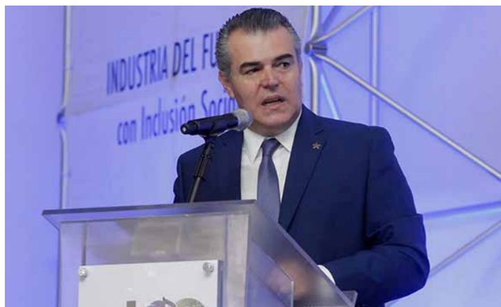
Los ganadores del Premio Ética y Valores 2018 por categoría se dieron a conocer durante la Reunión Anual de Industriales.