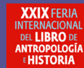
XXIX FERIA INTERNACIONAL DEL LIBRO DE ANTROPOLOGÍA E HISTORIA 27 de septiembre a 7 de octubre