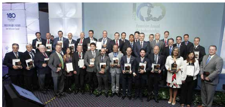
Grupo de empresarios que recibieron el Premio “Ética y Valores en la Industria 2018”.

La Editorial El Manual Moderno se fundó en 1958, con el objetivo de proporcionar, a los estudiantes de medicina, traducciones de los principales textos de la época a precios accesibles.