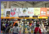
Feria del Libro de San Juan del Río, Querétaro 20 a 23 de septiembre